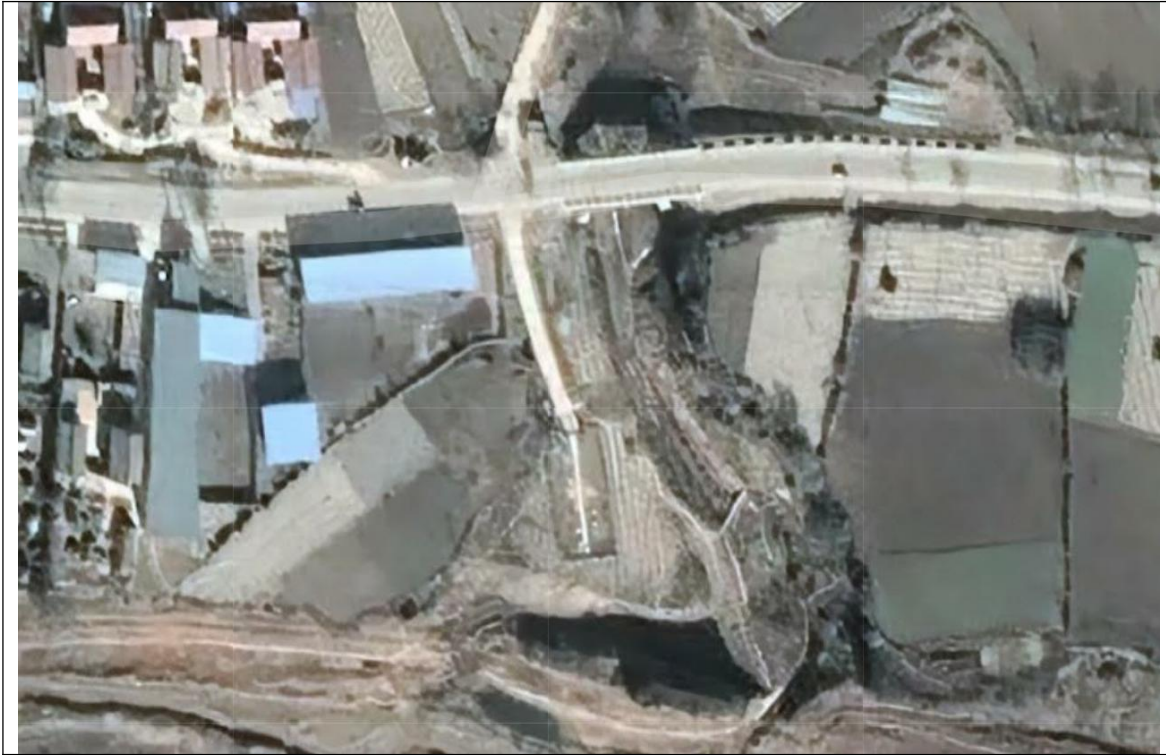
图 5-1 项目平面布置图

2021年12月，庄浪县永宁镇人民政府委托甘肃泾瑞环境监测有限公司对该项目进行竣工环境保护验收。接到任务后现场勘察，并于2021年12月13日至14日对庄浪县永宁镇污水收集处理工程产生的废水、废气、噪声进行了检测。